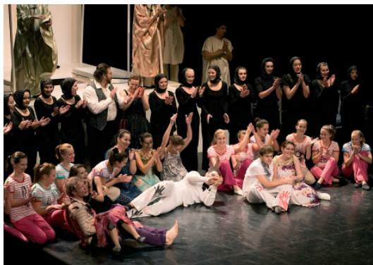
„Die Zauberflöte“ – das Ensemble in Wladiwostok